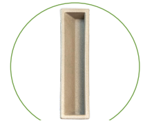
NOUVEAU! POIGNÉES ANTIMICROBIENNES

Circulation d'air filtré HEPA BREVET EN INSTANCE