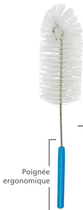
BROSSE RÉUTILISABLE À BOCAL / BOUTEILLE