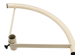
V-50007 POIGNÉE SEMI-RONDE EN COULEUR CRÈME