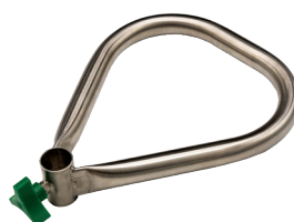
V-50006 POIGNÉE TRIANGULAIRE EN ACIER INOXYDABLE