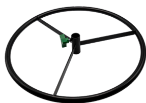
V-50003 POIGNÉE RONDE EN ACIER NOIR