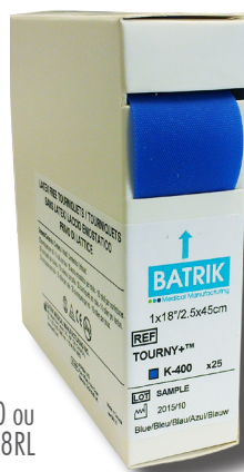
K-400 ou K-2-18RL

Contribuer à la politique d'usage unique avec nos 25 unités par rouleau, qui viennent dans une boîte distributrice pratique et facile d'accès!