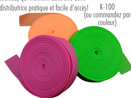
K-100 (ou commandez par couleur)

Contribuer à la politique d'usage unique avec nos 25 unités par rouleau, qui viennent dans une boîte distributrice pratique et facile d'accès!